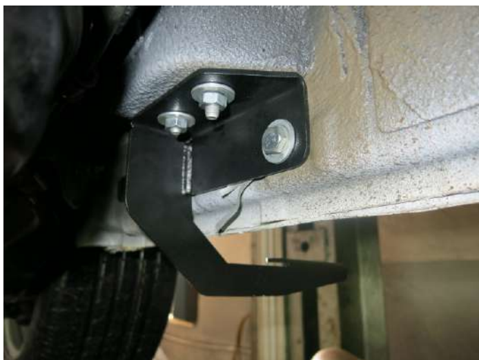
Рис. 4 - Установка заднего кронштейна