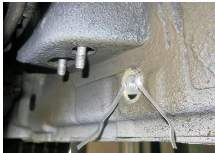
Рис. 2 - Установка закладных гаек и шпилек в средней части автомобиля