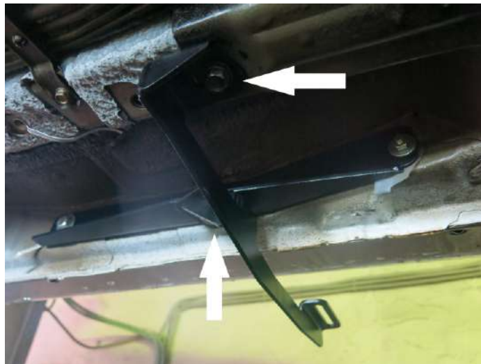
Рис. 5 - Установка переднего кронштейна