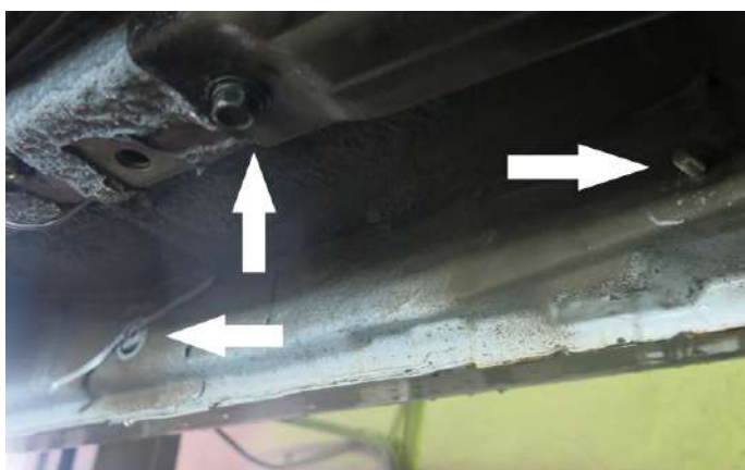
Рис. 1 - Установка закладных гаек и шпилек в передней части автомобиля