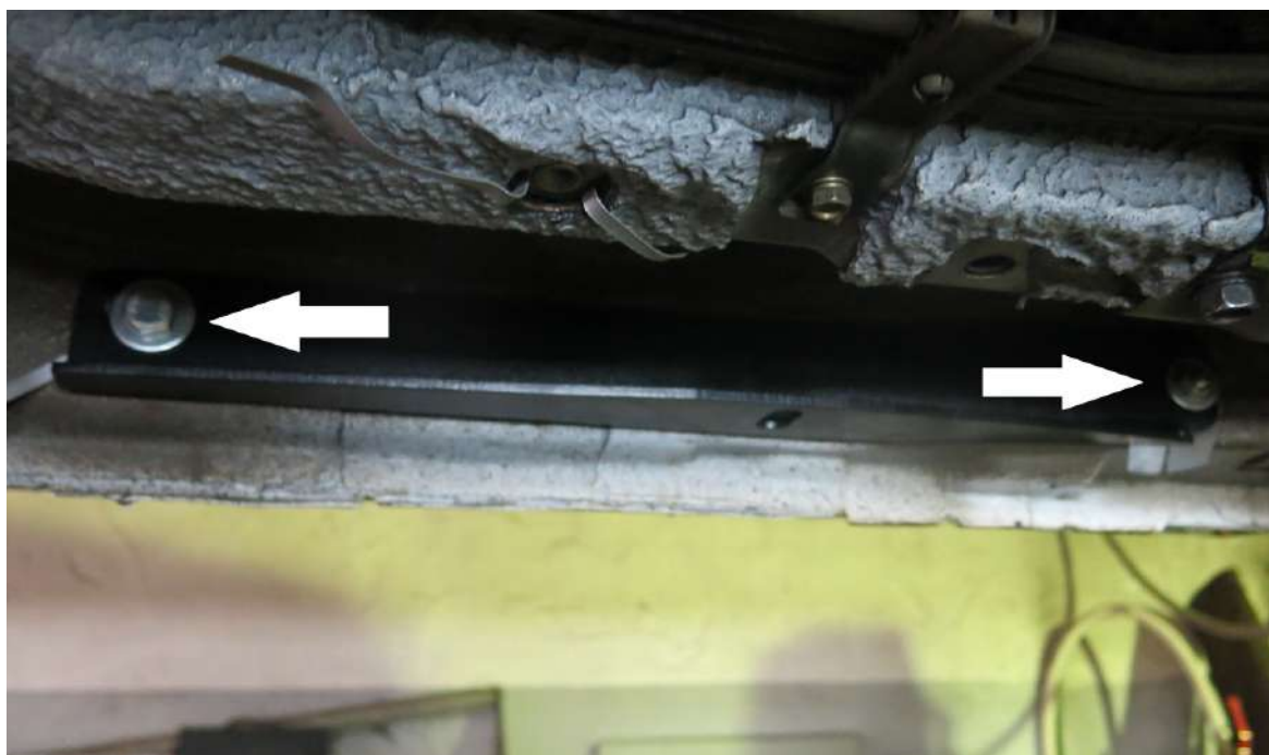
Рис. 3 - Установка опоры

Перед установкой изделия необходимо убедиться, что автомобиль, на который планируется установка, соответствует модельному ряду, указанному в настоящей инструкции. В случае затруднений с определением соответствия обращайтесь службу технической поддержки supr@rivalauto.com . В случае наезда на препятствие необходимо убедиться в отсутствии повреждений и агрегатов автомобиля и пригодности дальнейшей эксплуатации порогов. При правильной установке пороги не должны касаться узлов и агрегатов автомобиля. Производитель вправе вносить изменения в конструкцию порогов.